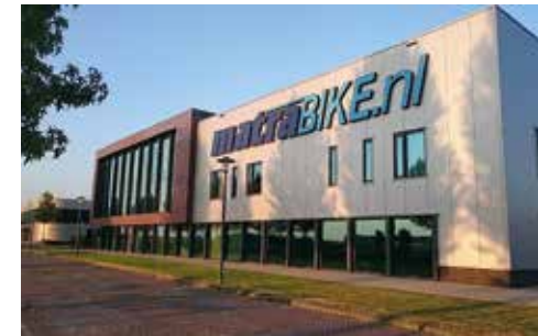
Matrabike Experience Center Waalwijk (NL)

Antwerpsestraat 83, 2840 Reet (gemeente Rumst), België. Tel. 038880990